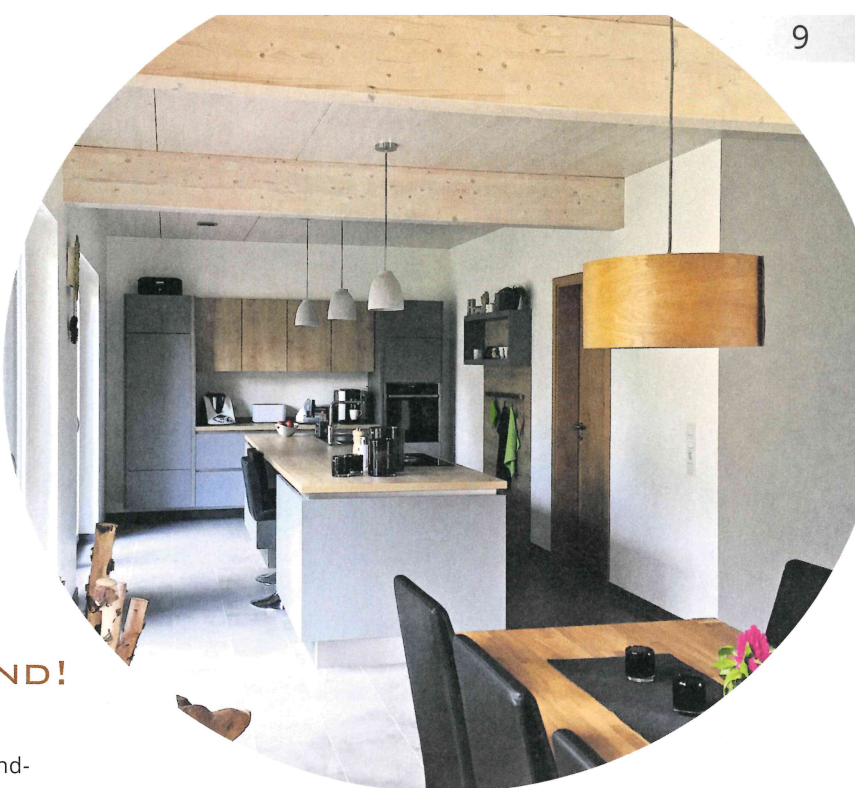
▲ Eine offene Küche mit weiß lasierter Massivholzdecke und Unterzügen.