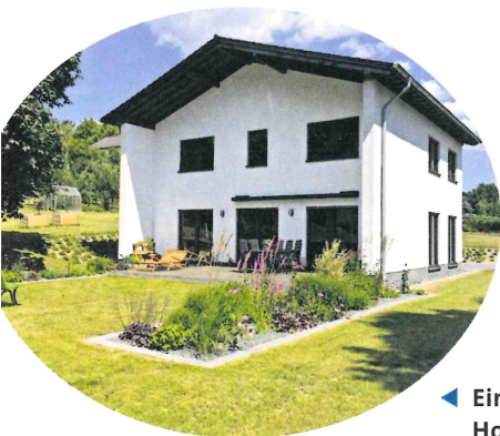
◀ Einfamilienhaus in Holzrahmenbauweise mit Putzfassade.