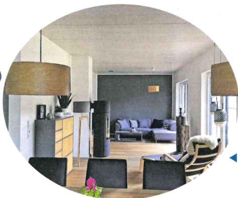
◀ Wohn- und Esszimmer mit einer Massivholzdecke aus Brettschichtholz-Elementen.

Die Gebäudehülle in Holzrahmenbauweise hat hervorragende Wärmedämm-Eigenschaften. Energetische Anforderungen (zum Beispiel die der Energieeinsparverordnung EnEV) erfüllen diese Häuser leicht auch mit geringen Wandstärken, ohne dass dabei wertvoller Wohnraum durch dicke Wände verloren geht.